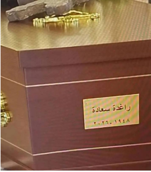
وداعاً راغدة أنطون سعادة