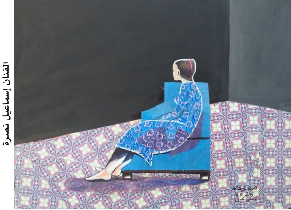
الفنان إسماعيل نصيرة